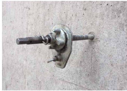
Anwendungsbeispiel: Abdichten des Bohrloches nach Einbringen eines Ankers | Example of use: Sealing of the borehole after insertion of an anchor